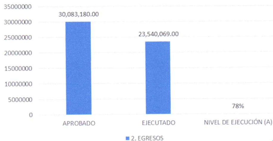
GRAFICO N°02: EJECUCIÓN DE EGRESOS 2025