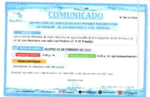
Interrupción programada de ejecución de empalme – C. P. El Triunfo