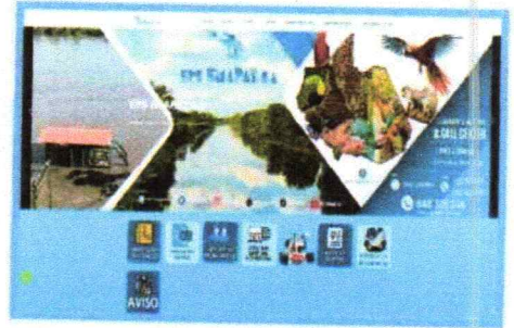
Página web: https://www.emapat.com.pe/

81.6. En caso la interrupción sea imprevista , la empresa prestadora comunica a los usuarios afectados y a la Sunass, en un plazo máximo de 8 horas de iniciada la interrupción . En el año 2026 la EPS EMAPAT emitió 46 comunicados por cortes imprevistos, ocasionados por terceros.