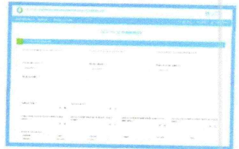
Aplicativo Registro de interrupciones de Sunass